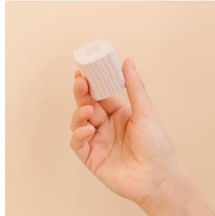
Papel y Madera FSC