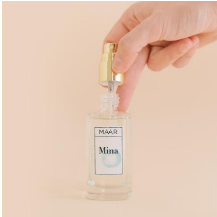
Reciclable por partes