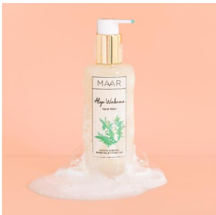
Frascos de vidrio