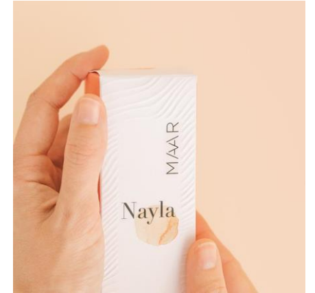
Proveedores de proximidad