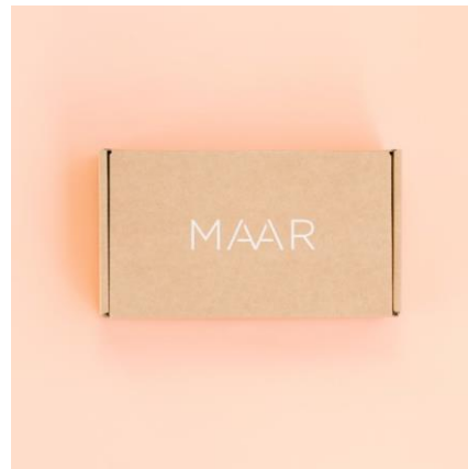
Envíos sin plástico