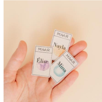
Etiquetas de Lino