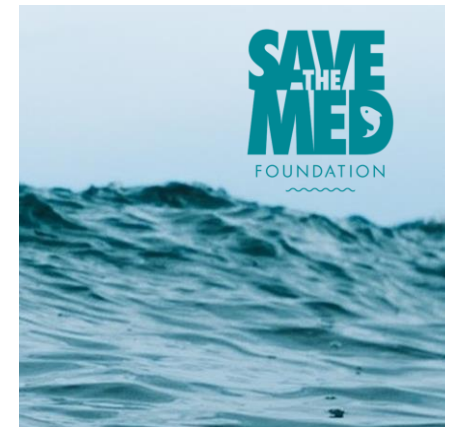
Donamos el 2%